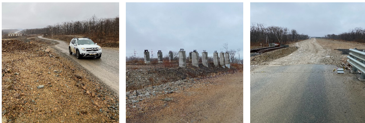
Участки Объекта-1, работы на которых приостановлены в связи с оползневыми процессами

С учетом нормативных сроков выполнения работ после прохождения государственной экспертизы корректировки ПСД 2022 года завершение строительства Объекта-1 ожидается только в 2024 году.