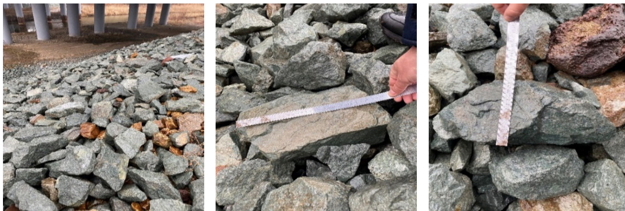
Мост через старицу р. Шкотовка на ПК83+66,49