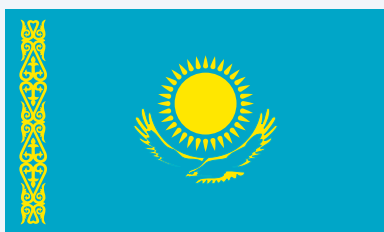
Счетный комитет по контролю за исполнением республиканского бюджета Республики Казахстан