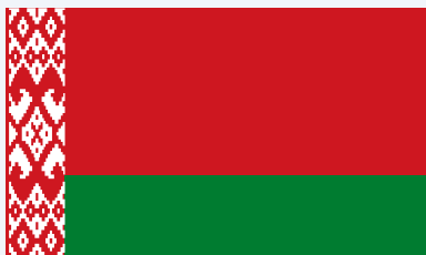
Комитет государственного контроля Республики Беларусь