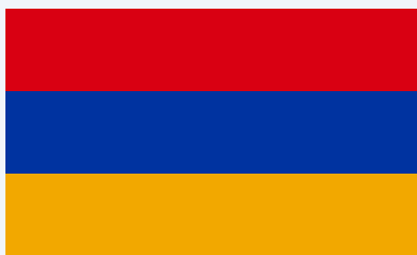
Аудиторская палата Республики Армения