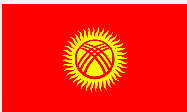
Счетная палата Кыргызской Республики