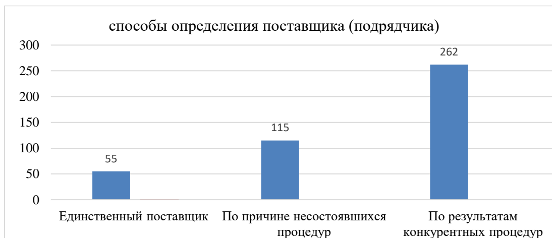
Рисунок № 3

По информации, размещенной в ЕИС, для закупок из генеральной совокупности по выполнению работ по капитальному ремонту объектов в разрезе способов определения подрядчика установлена следующая декомпозиция закупок (Рисунок № 3). При этом, несмотря на наличие конкуренции, 26,6% контрактов заключены по результатам несостоявшихся процедур.