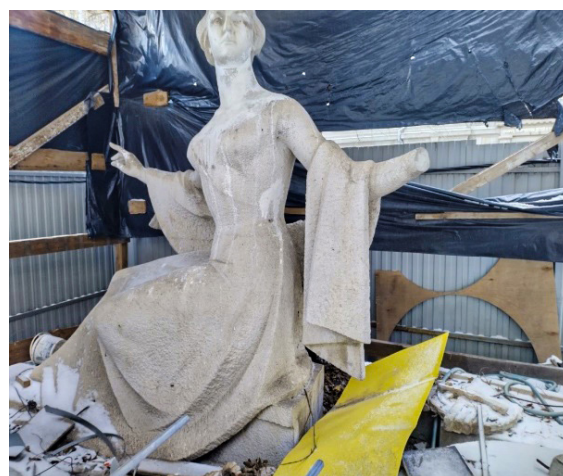
Фото 4. Фигура Оперы среди строительного мусора