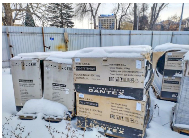
Фото 3. Оборудование на строительной площадке