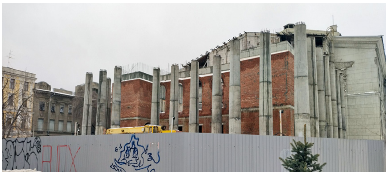
Фото 2. Здание театра на момент проведения контрольного мероприятия

Техническим заказчиком ГКУ СО «УКС» не была осуществлена передача подрядной организации строительной площадки объекта «Театр оперы и балета» 17 . Акт передачи объекта к производству работ от 9 сентября 2020 г. б/н был заключен непосредственно между ГАУК «Саратовский академический театр оперы и балета» и подрядчиком ООО «АДЕПТ СТРОЙ». При этом только 23 октября 2023 года здание театра распоряжением комитета по управлению имуществом Саратовской области было исключено из состава имущества, находящегося на балансе ГАУК «Саратовский академический театр оперы и балета» и передано техническому заказчику.