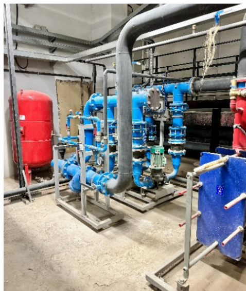
Фото 8. Смонтированное оборудование теплового пункта