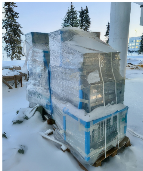
Фото 9. Оборудование, хранящееся на улице

В ходе произведенного осмотра установлено, что на объекте смонтировано и готово к эксплуатации вентиляционное оборудование. В то же время часть оборудования хранится на стройке в условиях, не соответствующих требованиям хранения.