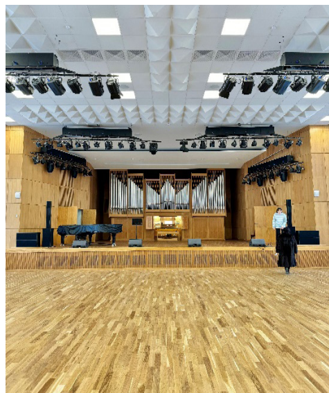
Фото 7. Органный зал после завершения работ