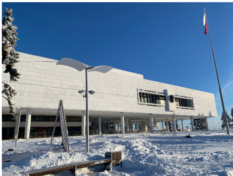
Фото 6. Фасад здания после завершения работ

В результате существуют риски по деформации объекта культурного наследия «Ленинский мемориальный центр» и утраты результатов ремонтно-реставрационных работ, проводимых на вышеуказанном объекте.