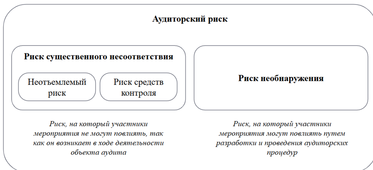
Рисунок 2. Компоненты аудиторского риска.

7.2. Риск существенного несоответствия – это риск того, что информация о предмете аудита соответствия содержит в себе существенные несоответствия, то есть несоответствия которые как по отдельности, так и в совокупности могут повлиять на решения пользователей.