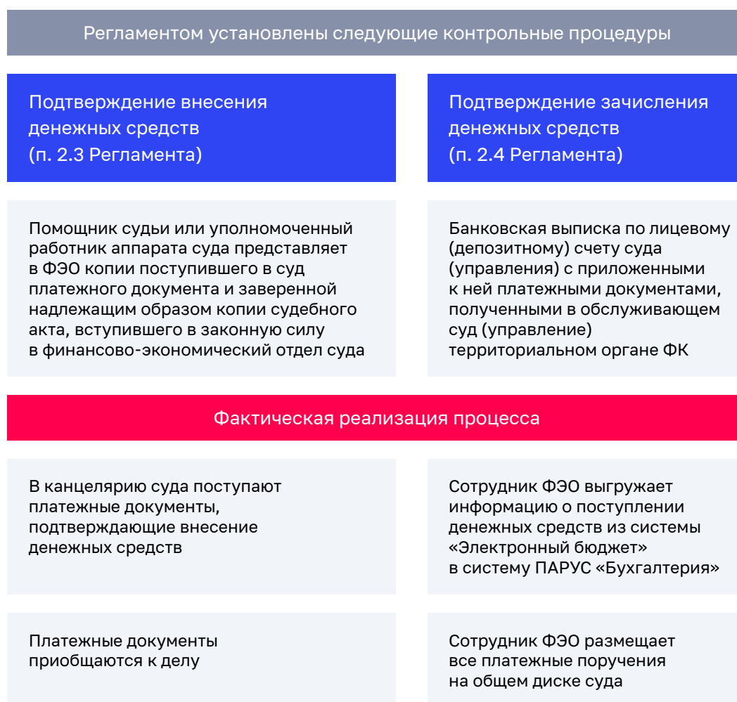
Рисунок 1. Реализация арбитражными судами пунктов 2.3 и 2.4 Регламента

Не всеми АС соблюдаются положения пунктов 2.3 и 2.4 Регламента в полной мере 11 . Сравнение выполнения установленных пунктами 2.3 и 2.4 Регламента контрольных процедур с процедурами, выполняемыми Арбитражным судом г. Москвы и Девятым арбитражным апелляционным судом на практике, представлено на рисунке 1.